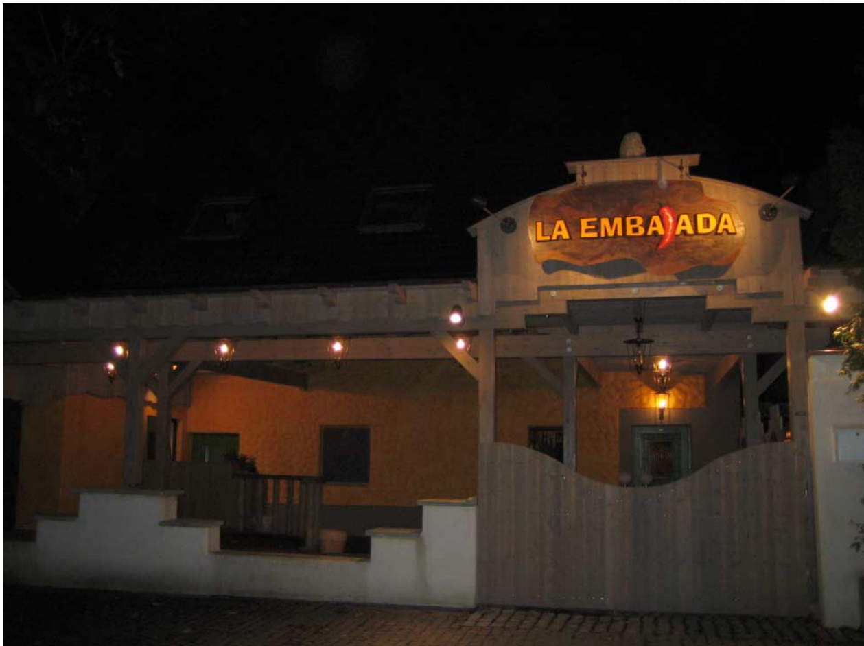
La Embajada, Tuttlingen