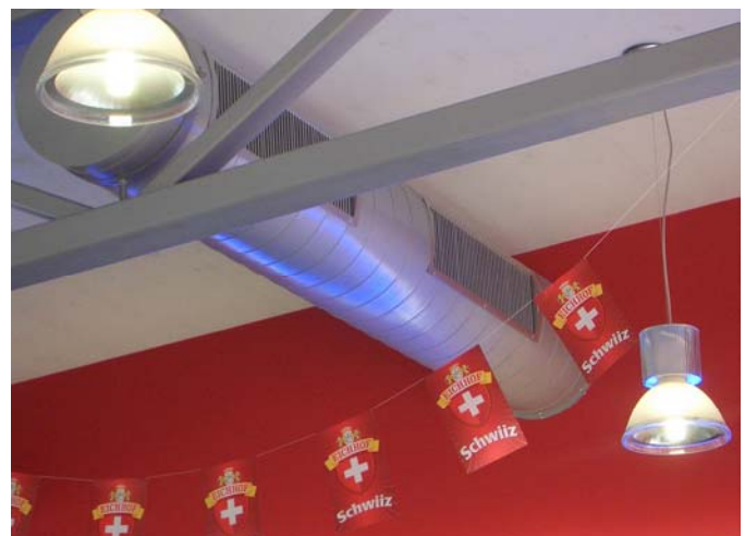
BURGER KING, Winterthur (Switzerland)

Ferdinand Schad KG Steigstraße 25 – 27 D-78 600 Kolbingen (Zweigniederlassung)