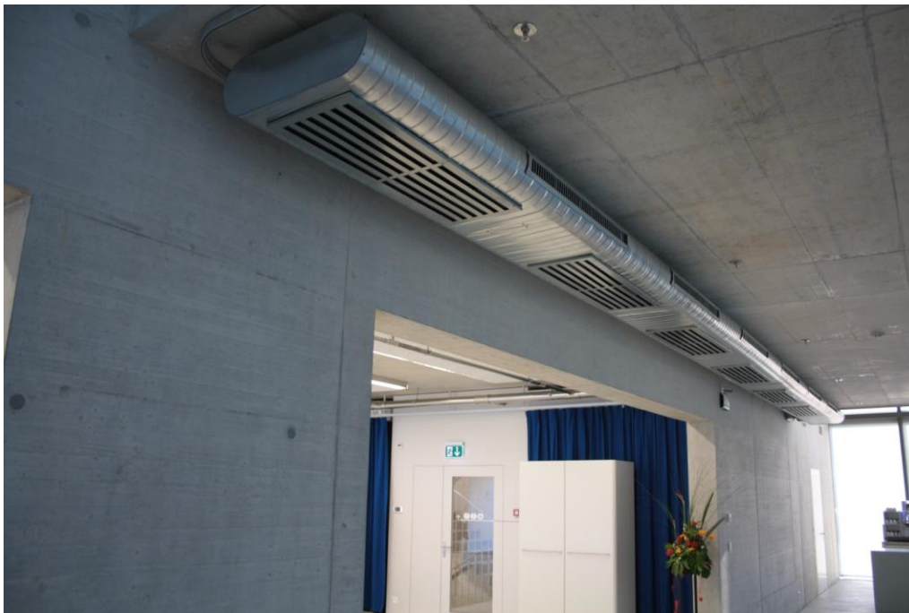
Nussbaum AG, Trimbach (Switzerland)