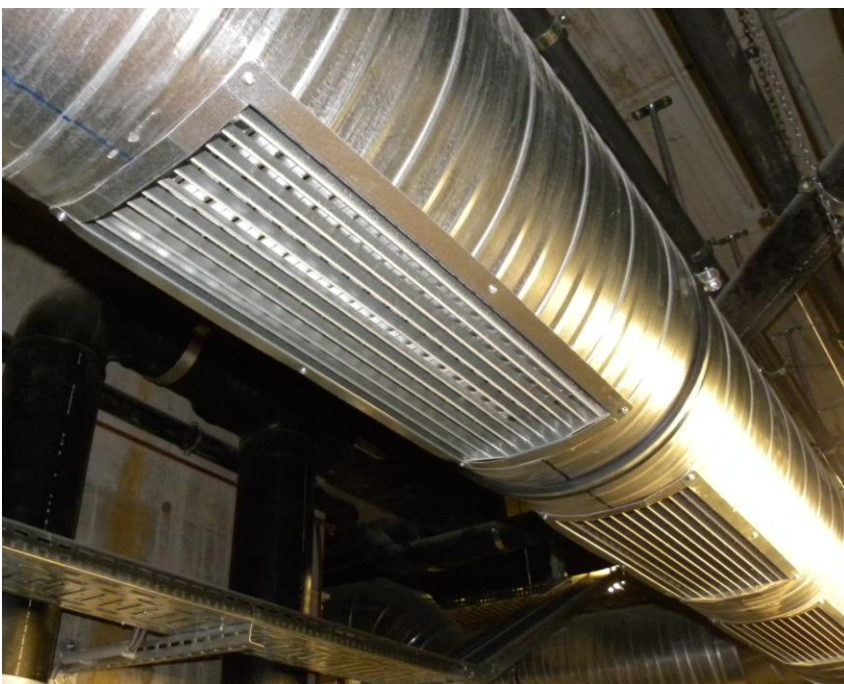
Fun pool, Titisee Neustadt

Ferdinand Schad KG Steigstraße 25 – 27 D-78 600 Kolbingen (Zweigniederlassung)