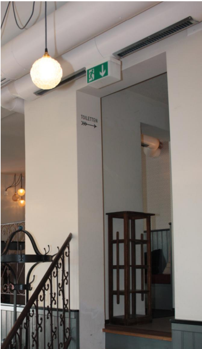
Cafe Bar Nordstrasse, Zurich (Switzerland)

Ferdinand Schad KG Steigstraße 25 – 27 D-78 600 Kolbingen (Zweigniederlassung)