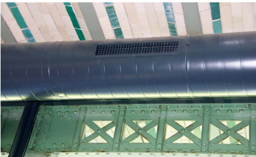
De Duivenschieting, Oostende (Belgium)

Ferdinand Schad KG Steigstraße 25 – 27 D-78 600 Kolbingen (Zweigniederlassung)