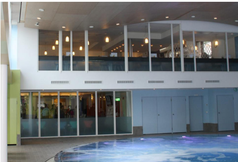
Sole Uno Kur/Wellness Oase, Rheinfelden (Switzerland)

Ferdinand Schad KG Steigstraße 25 – 27 D-78 600 Kolbingen (Zweigniederlassung)