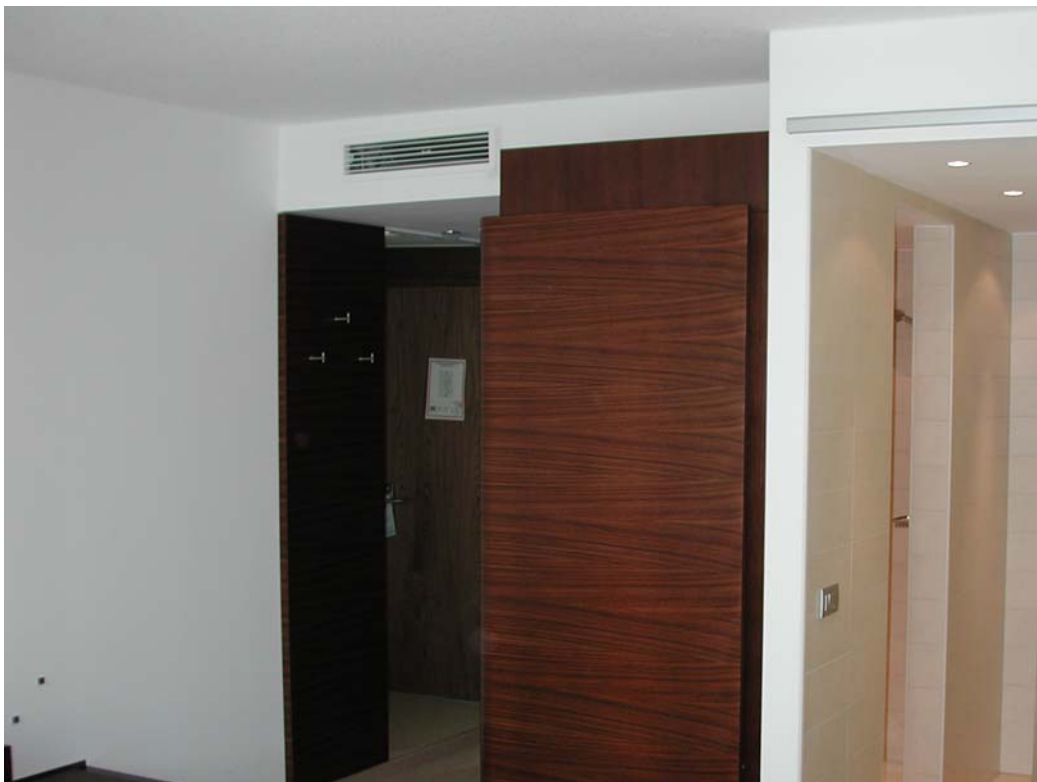
ASAM Hotel, Straubing

Ferdinand Schad KG Steigstraße 25-27 D-78600 Kolbingen (Zweigniederlassung)