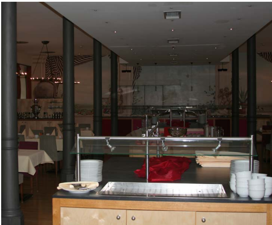
Hotel Restaurant, Ludwigsburg