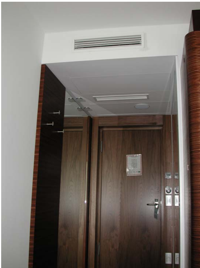
ASAM Hotel, Straubing