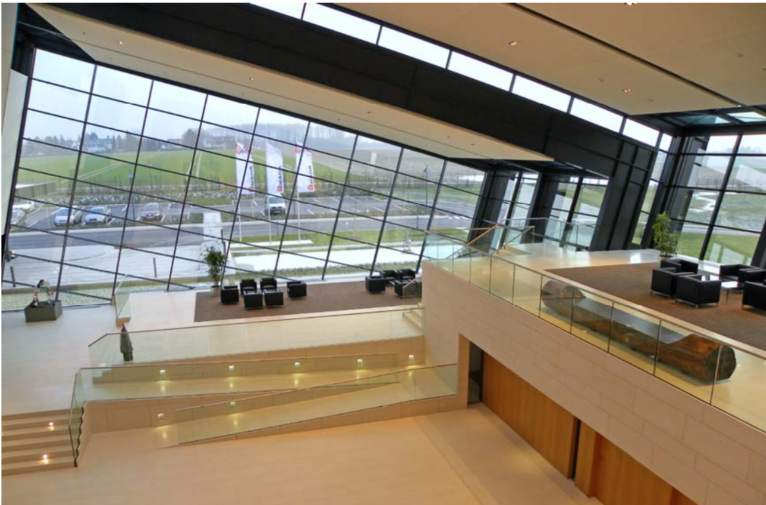
Amada Solution Center, Haan