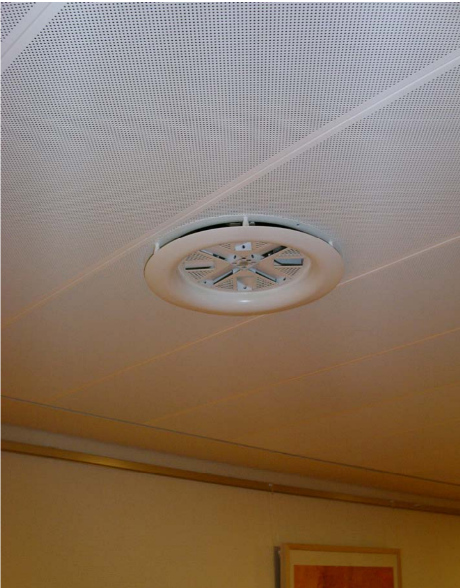
Hopital, Kirchberg (LUX)

Ferdinand Schad KG Steigstraße 25 – 27 D-78 600 Kolbingen (Zweigniederlassung)