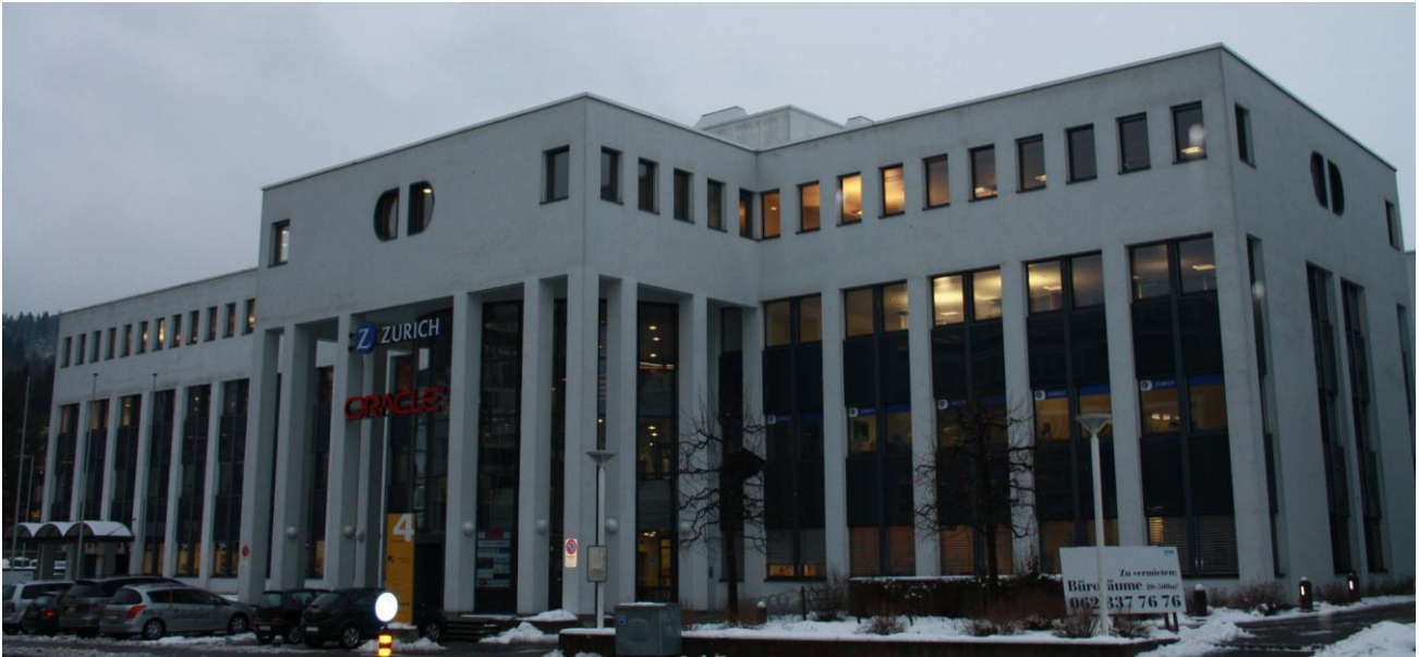
Oracle GmbH, Baden-Dättwil, Zürich (CH)