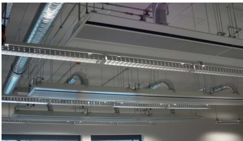
SMA Geb.44a, Kassel