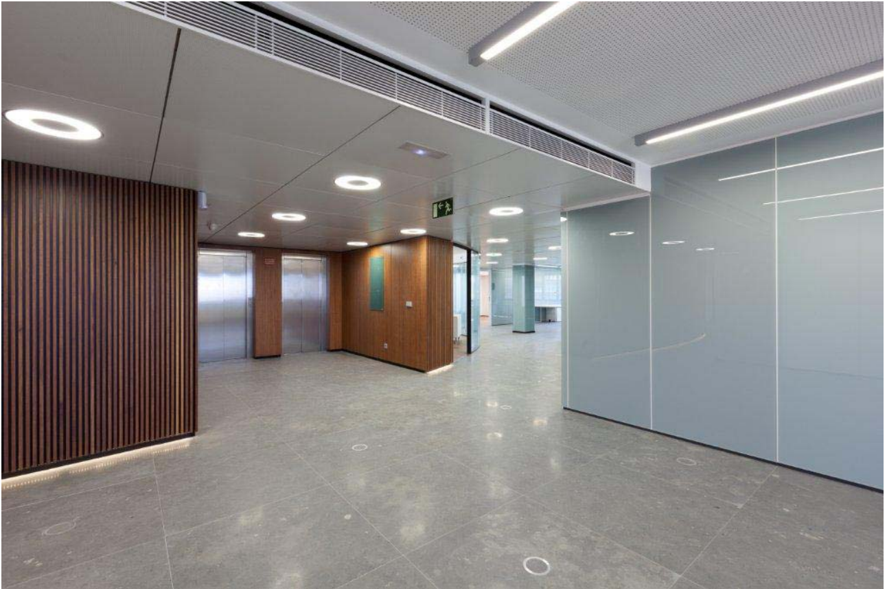
FISCALIA, Madrid (Spain)