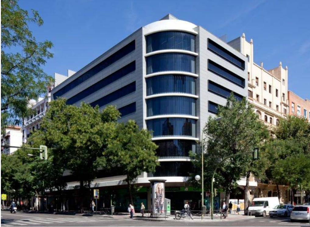
FISCALIA, Madrid (Spain)