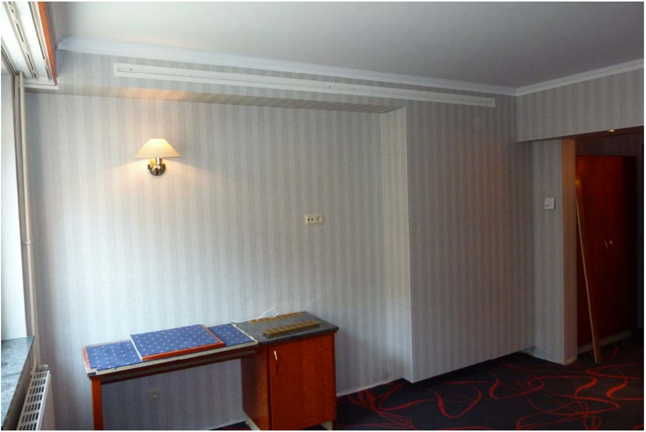
Hotel Koener, Clervaux, (LUX)