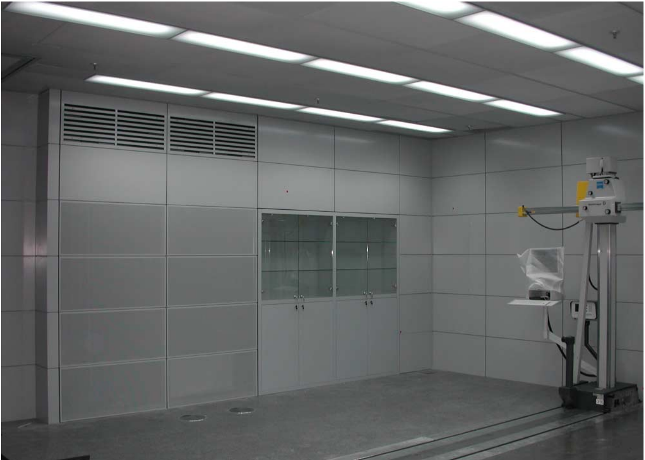
AUDI Ingolstadt - Design-Check