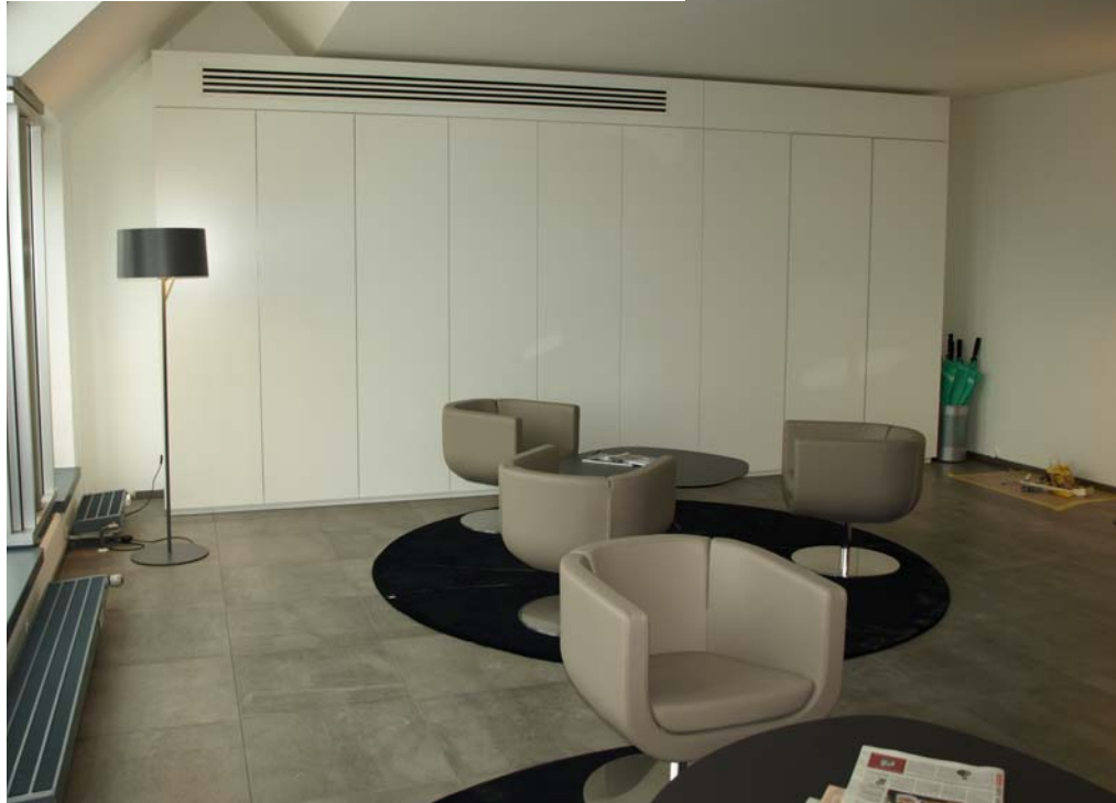
Rieger City, Munich