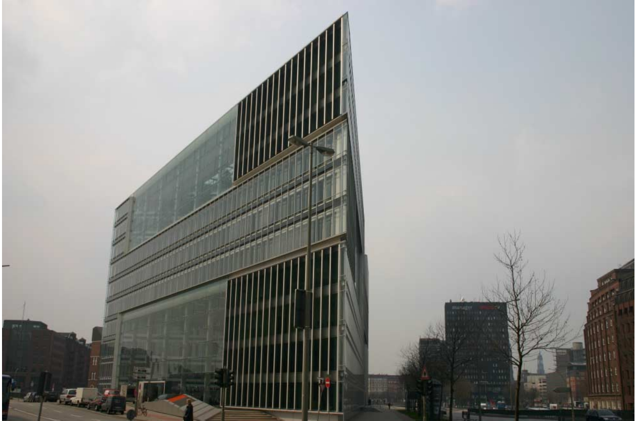
ZDF Deichtor-Center, Hamburg