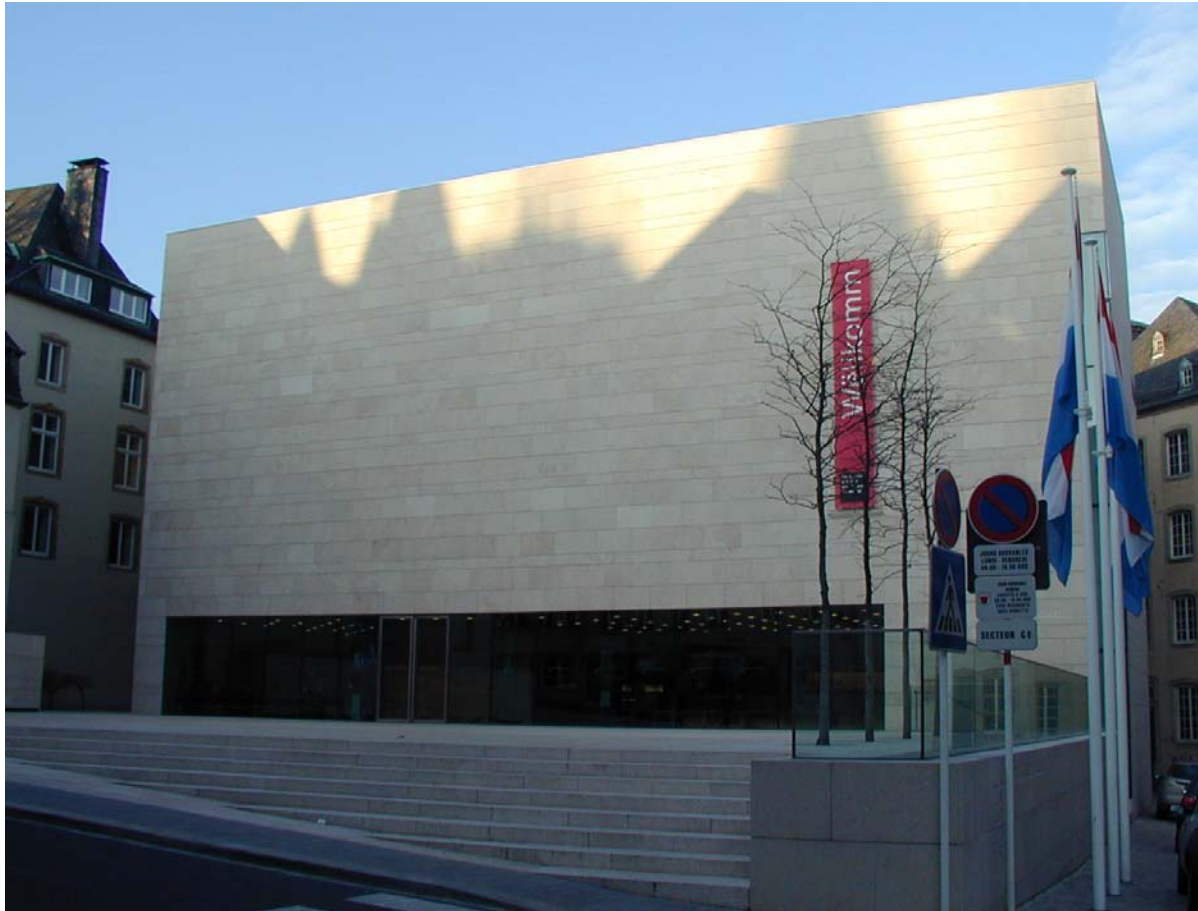
Musee national d'histoire (LUX)