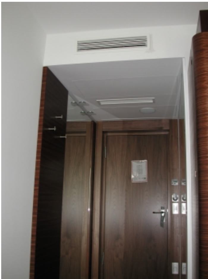
ASAM Hotel, Straubing