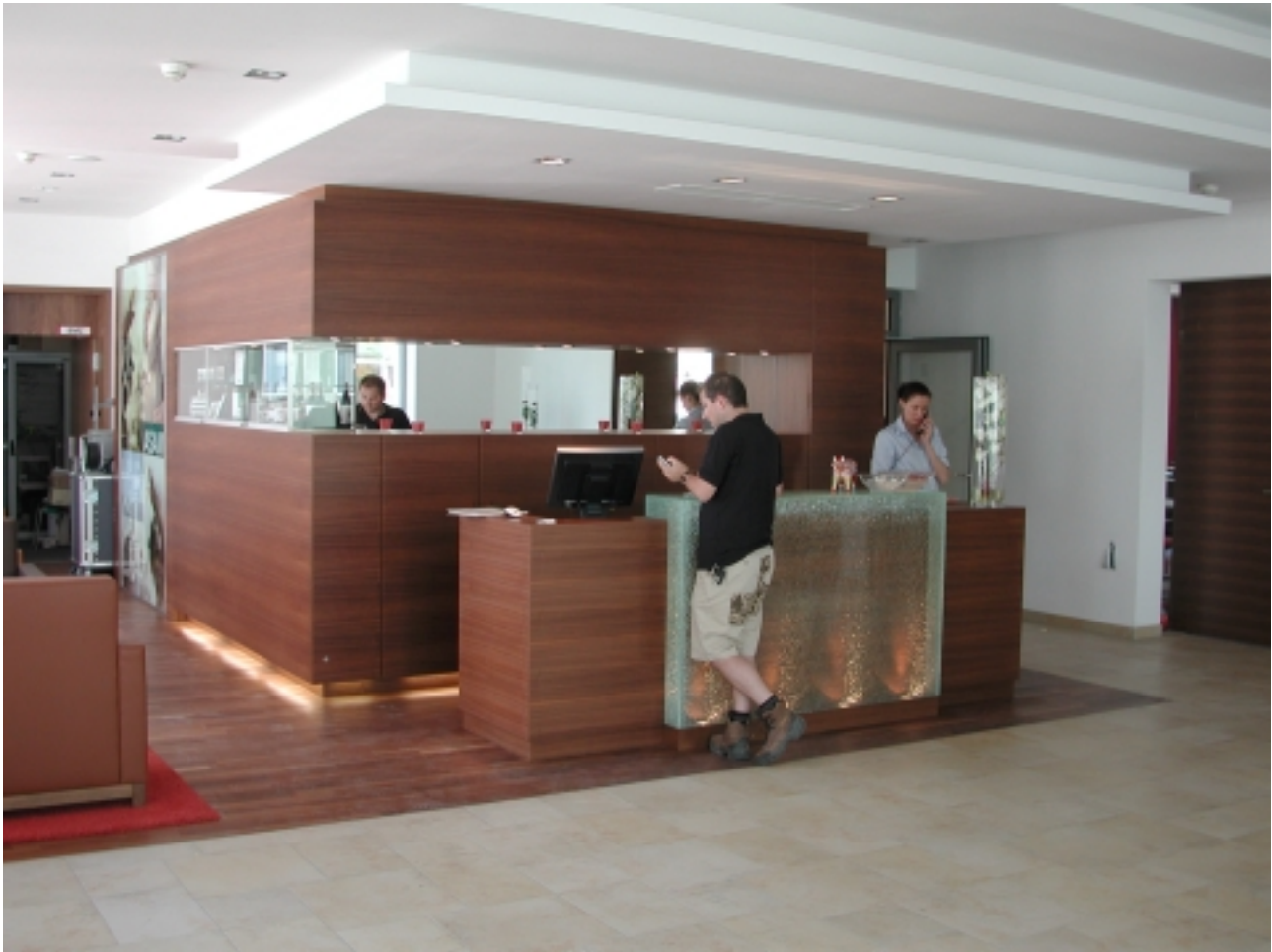
ASAM Hotel, Straubing