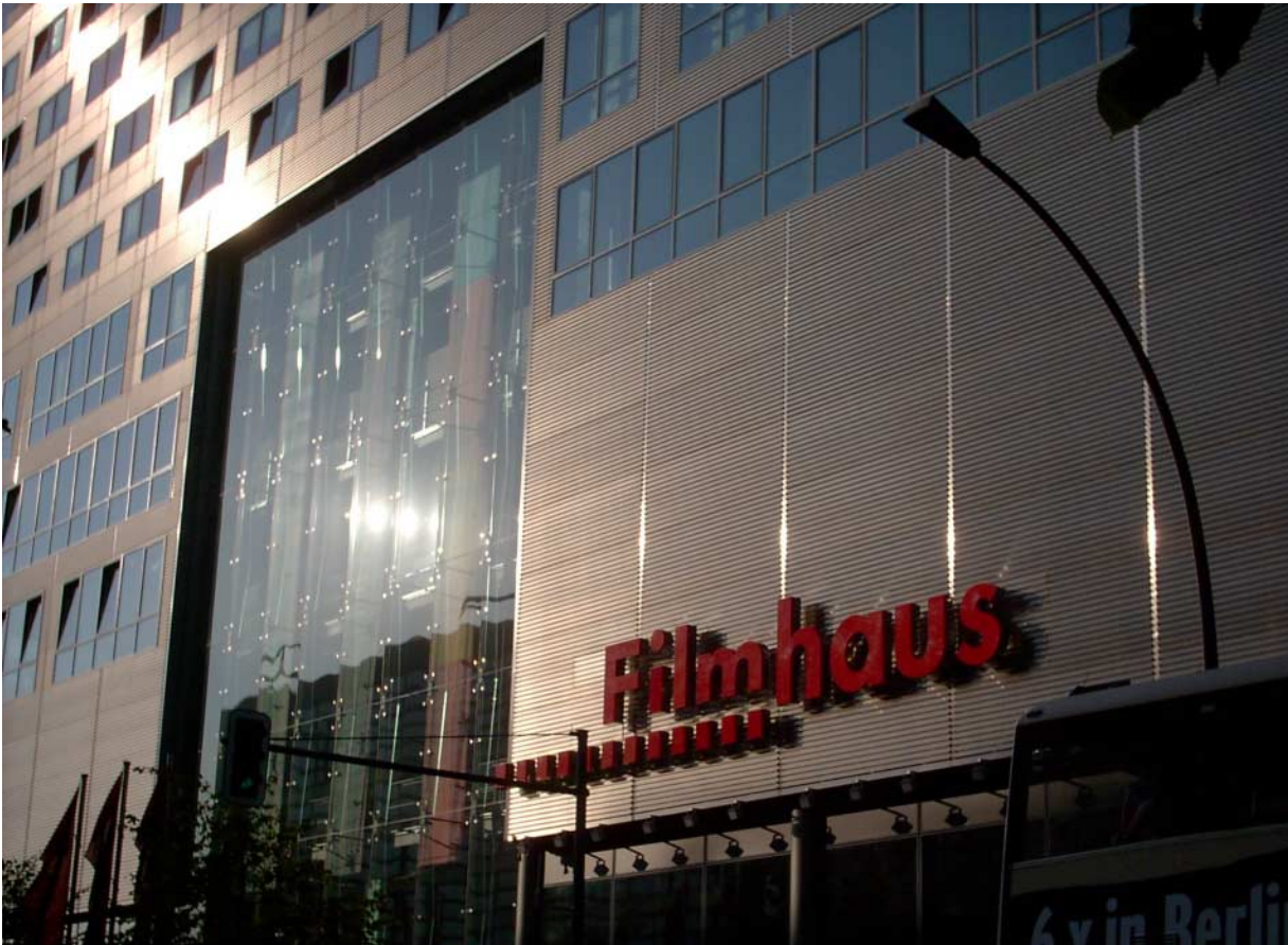
Film-Museum Potsdamer Platz, Berlin