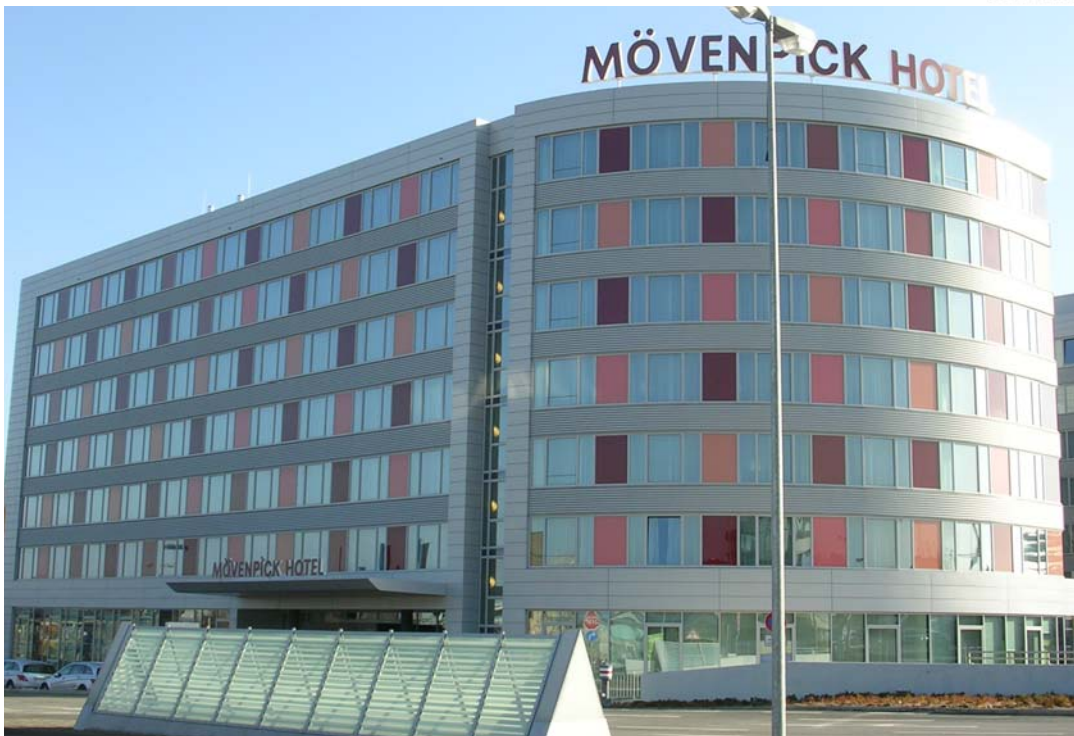
Mövenpick Hotel, Stuttgart