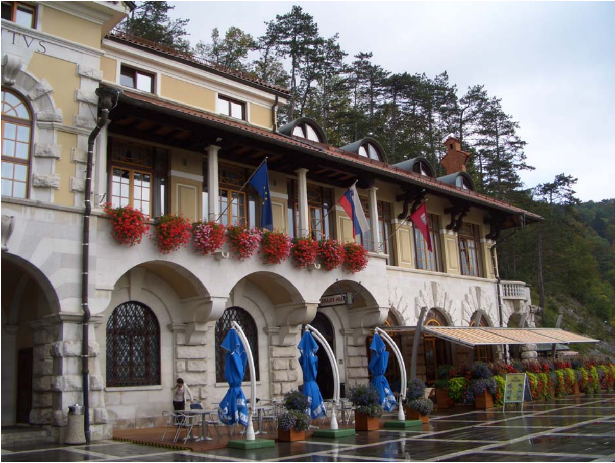
Hotel Jama, Postonska (Slovenien)