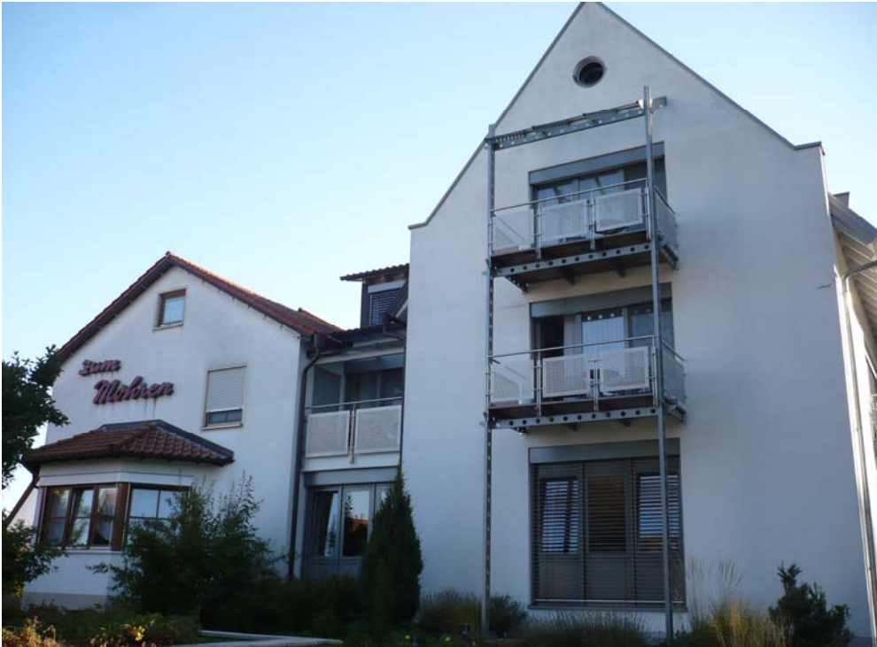
Hotel Mohren, Stetten ob Lonetal