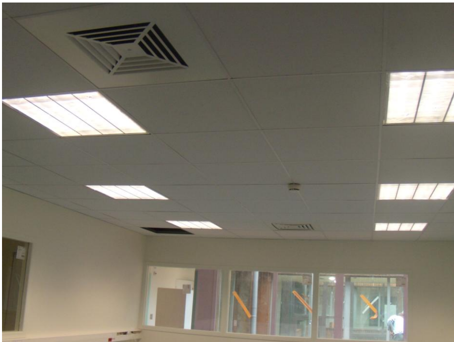
Krankenhaus, Vichy (Frankreich)