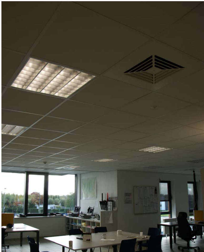
Politiekantoor, Ieper (BEL)